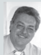
Otto Breslauer Bonduelle Deutschland GmbH