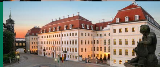
Hotel Taschenbergpalais Kempinski Dresden Taschenberg 3, 01067 Dresden

23 Fachthemen zur Auswahl – nutzen Sie die Möglichkeit, Ihr persönliches Fachwissen gezielt zu erweitern und stellen Sie sich Ihr ganz individuelles Weiterbildungsprogramm zusammen.*