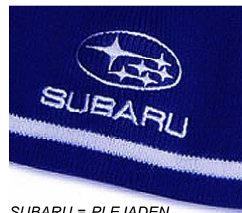
SUBARU = PLEJADEN mehr als ein Logo: Pfeiler am "Goldenen Tor der Ekliptik" im Sternbild Stier