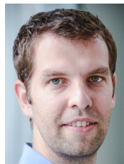
Matthias Rink artiso solutions GmbH