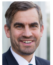
Georg Wunsch machineering GmbH & Co. KG