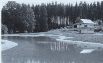
Klostergelände mit japanischem Tee-Haus

Ort: Daishin Zen-Kloster und Seminarzentrum Buchenberg (nahe Kempten/Allgäu)