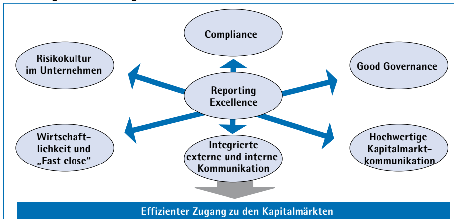
Abbildung 4: Zielsetzungen der berichterstattenden Kreditinstitute

Säule-3-Bericht), zu vermeiden ist die Konsistenz von handelsrechtlichen und aufsichtsrechtlichen Risikoberichten von zentraler Bedeutung. Ein möglichst weitgehend integriertes externes Risikoberichtswesen schafft die strukturellen Voraussetzungen für den erforderlichen Gleichlauf und trägt damit zur Minimierung von Prospekthafungsrisiken bei.