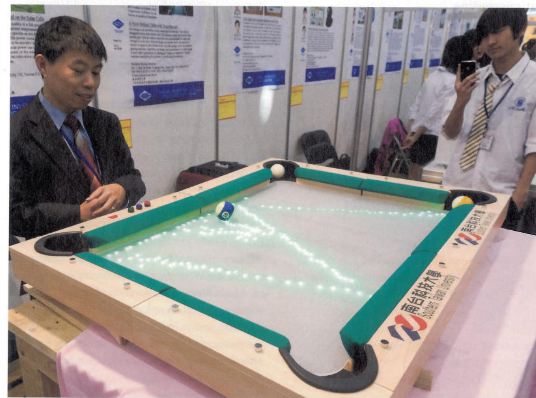
ERFINDERMESSE Ein Armreif, der an die Medikamenteneinnahme erinnert, oder ein Billardtisch, der den Weg der Kugel nachzeichnet: Jede Innovation braucht optimale Voraussetzungen.