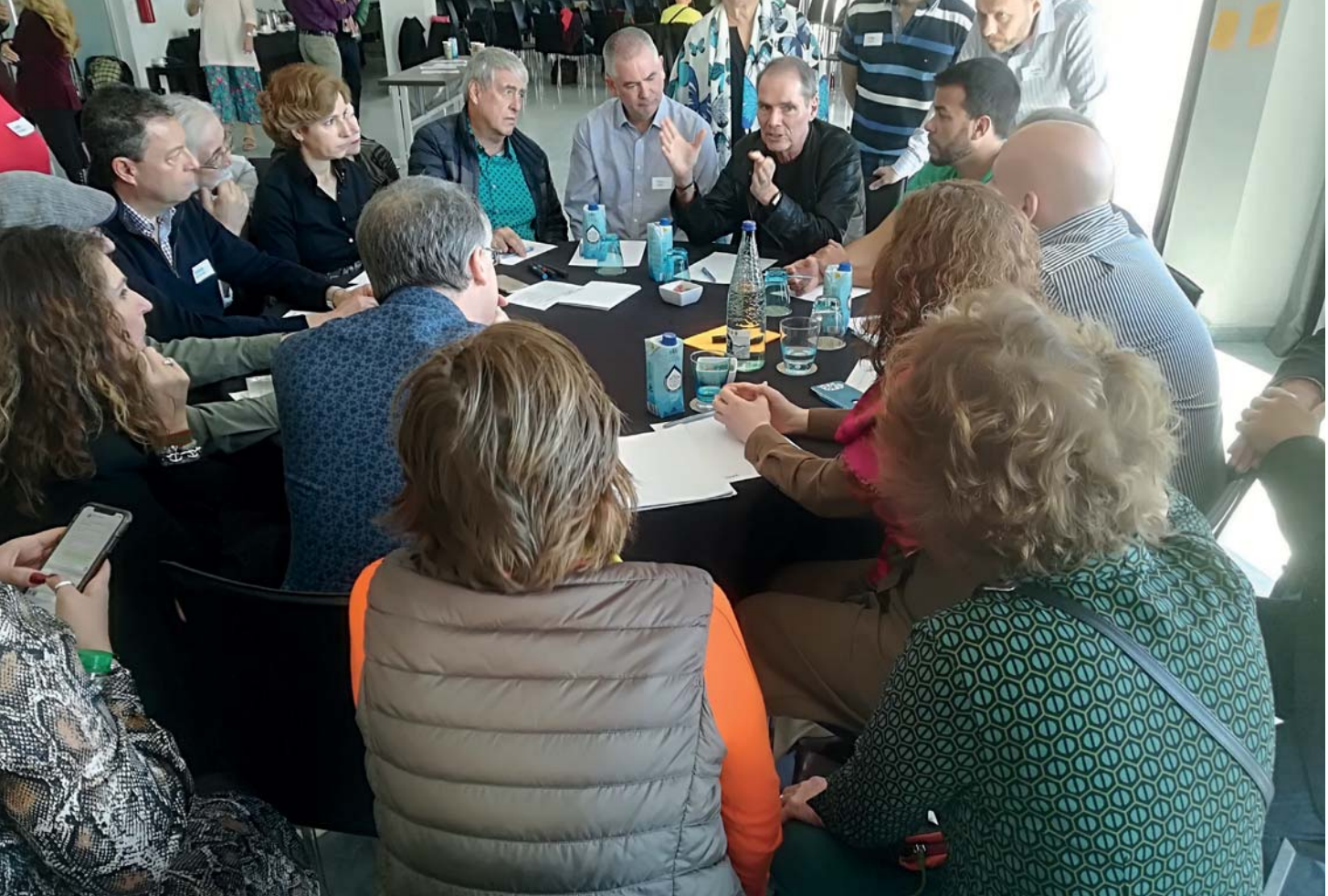
Robert Dilts (im dunklen Hemd, oben, rechts von der Mitte) in einer Diskussionsrunde auf dem NLP Leadership Summit, Anfang des Jahres in Alicante, Spanien.