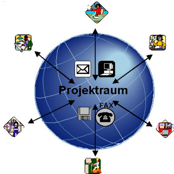
System der Kommunikation über internetbasierte Projekträume

Die Gleichartigkeit des Mediums wird also durch die Einstiegsvoraussetzung "Internet" definiert. Um nun eine nachvollziehbare Abwicklung für jeden Teilnehmer zu erreichen bedient sich die internetbasierte Projektkommunikation einer Softwarelösung die alle Projektmitarbeiter im Internet zusammenfinden läßt. Es wird ein virtueller Raum geschaffen indem für jeden Nutzer ähnliche Bedingungen anzutreffen sind, die es ihm ermöglichen mit den anderen Projektteilnehmern zu kommunizieren und Daten auszutauschen. Dieser virtuelle Raum ist der "Projektraum".