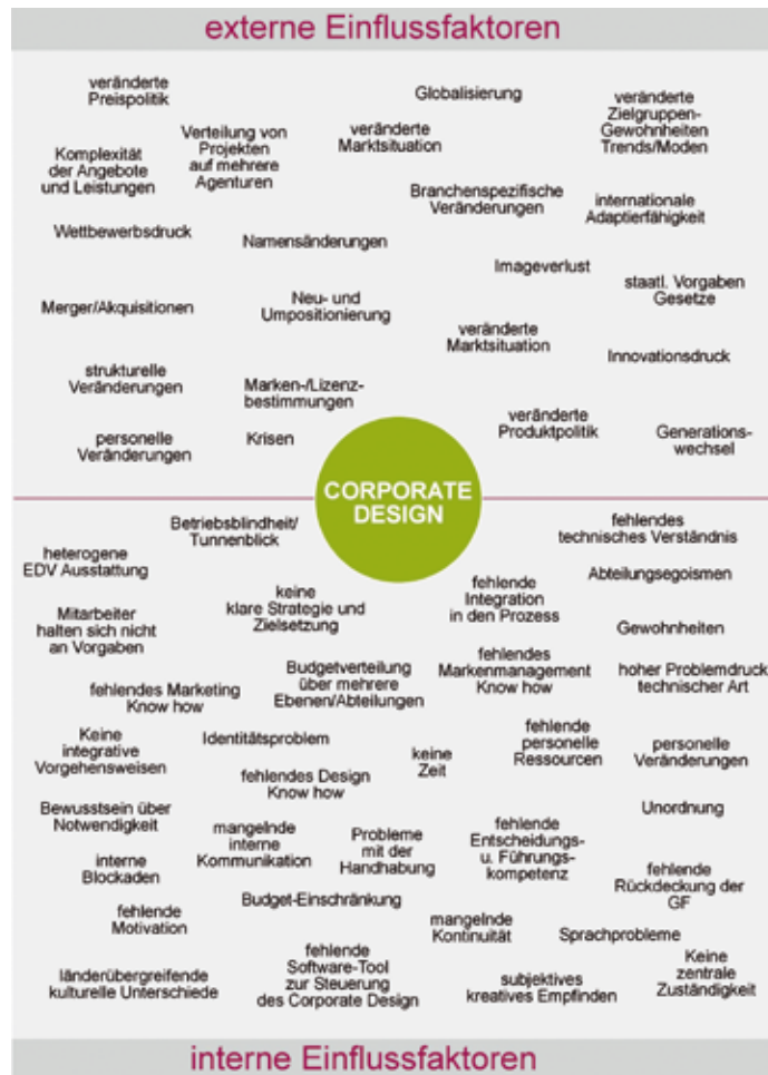
Bild 2: © Corporate Design Management / Landkarte der Einflussfaktoren. Abgeleitet aus „Change Management“/Klaus Doppler

Je mehr Personen unterschiedlicher Abteilungen und Agenturen an diesem