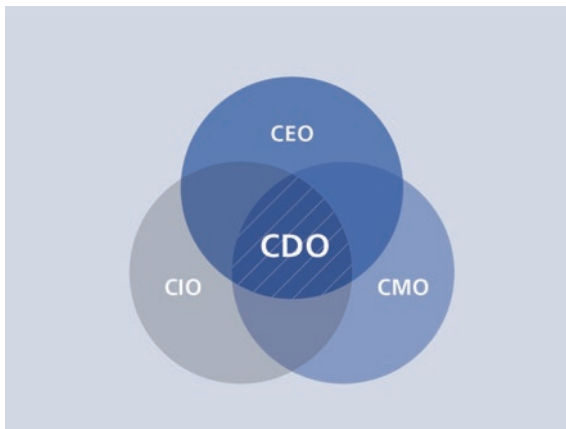
Abb. 2.3 Schnittmenge CDO mit CEO, CIO und CMO