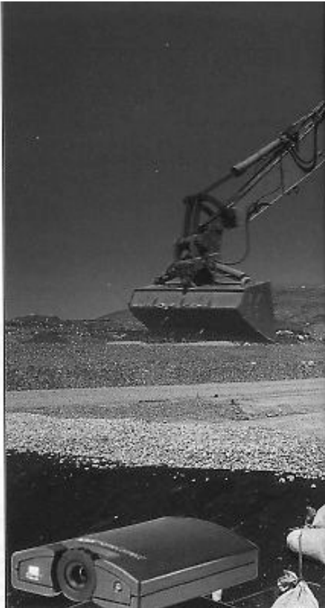
Eine der eingesetzten Webcams auf der Deponie

Nur der äußerst verantwortungsvolle Umgang mit Mensch und Natur bei der Abfallentsorgung garantiert, dass es für uns alle überhaupt ein Morgen gibt. Und genau dies ist die Leistung der IAG, über die die Öffentlichkeit informiert sein sollte.