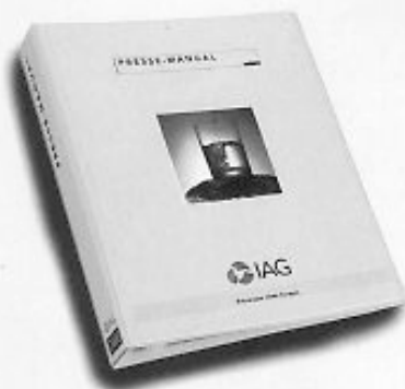
Das individuell zusammengestellte Pressekit – exklusiv für die Kunden der IAG

Es entsteht das Bild von einem „Competence-Center Ihlenberg“. Und das ist gut so.