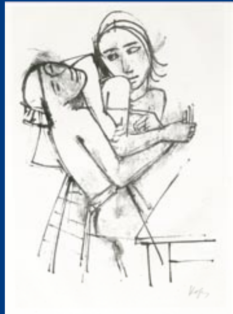
Karl Hofer, Zenana II, 1923

Von 1922 an beherrscht Hofer seinen graphischen Stil, der sich mehr und mehr in der Lithographie verkörpert. Klar und deutlich wird das Thematische ausgesprochen, reduziert auf den gesammelten Ausdruck, ohne Modulierungen, fixiert in Schwarzweiß als zeichnerische Kraft.