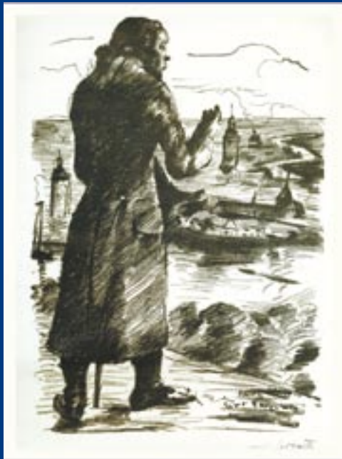
Lovis Corinth, Wanderer vor in Fluten versinkender Landschaft, ca. 1920

Der bedeutende impressionistische Maler Lovis Corinth wurde als Franz Heinrich Louis Corinth im ostpreußischen Tapiaw, dem heutigen Gwardesjk im russischen Oblast Kaliningrad, geboren. Er verstarb in Amsterdam. Sein Werk verteilt sich auf große Sammlungen deutscher und internationaler Museen.